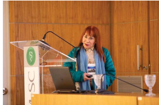
Auditório lotado para ouvir os destacados palestrantes no grande evento sobre saúde mental de crianças e adolescentes catarinenses