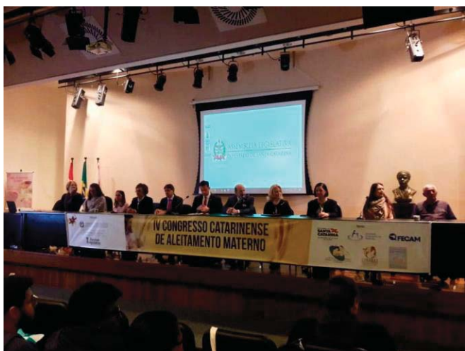
O IV Congresso Catarinense de Aleitamento Materno reuniu os principais profissionais que atuam na defesa da saúde dos recém-nascidos